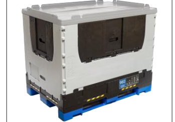
12. Doludan sonra alım klapeleri kapatılır ve kapak takılır.