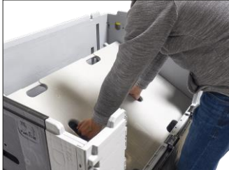
9. Ara göz her zaman önce öndeki paneli yuvasına yerleştirilmelidir. Sonrasında arkadaki panelin uzun yuvalarına yerleştirilir.