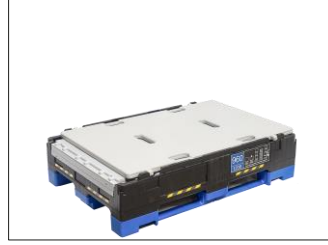
2. Kapağı çıkarın, varsa SHS ara gözünü çıkarın.