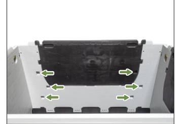
8. Ön panelin iç tarafında bulunan ara gözlerin muylularını için yuvalar.