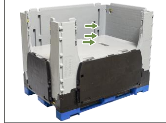
6. SHP'nin iç hacmi opsiyonel olarak iki adet ara göze sahip iki veya üç bölgeye ayrılabilir.