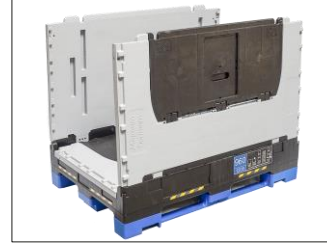
3. Her iki uzun yan paneli sırasıyla kurun.