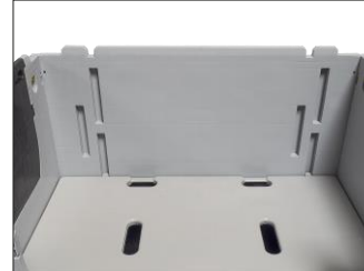
11. Yerleştirilmiş ara göz.