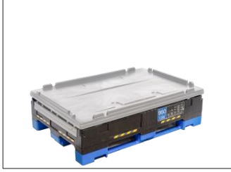
1. Katlanmış SHP.