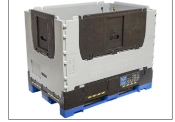
4. Her iki kısa yan paneli sırasıyla kurun ve uzun yan panellere oturtun.