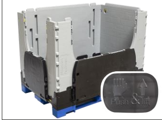
5. Daha iyi yükleme yapabilmek için alım klapeleri açılabilir, bunun için alım klapesini içe doğru bastırın ve sonra yukarı doğru çekin.