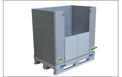
6. Daha iyi tutabilmek için açık olan alım klapesi halkanın çitçitine sabitlenebilir; böylece sıkı biçimde halkada bulunur.