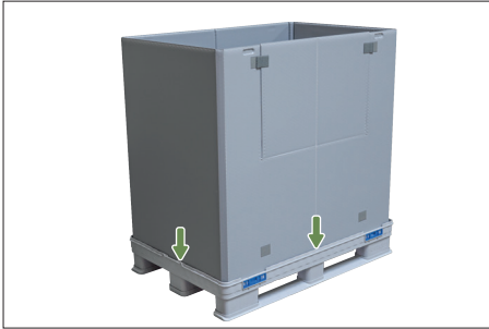
4. Halka tamamıyla açılır ve ana kutunun yuvalarına bastırılır. Kapakların manuel olarak kilitlemesine gerek yoktur.