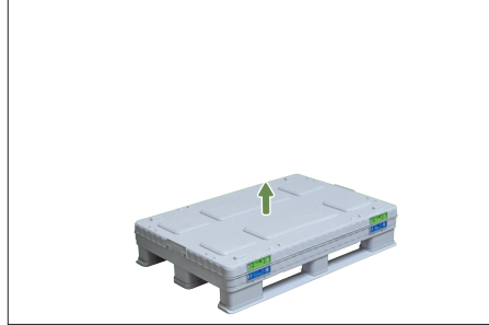
2. Kapağı çıkarın.