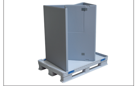
3. Katlanmış halka kurulur ve açılır.