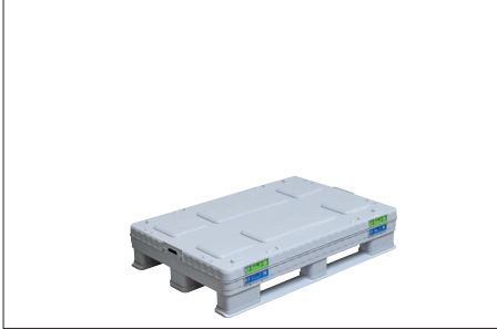
1. Katlanmış SLP.