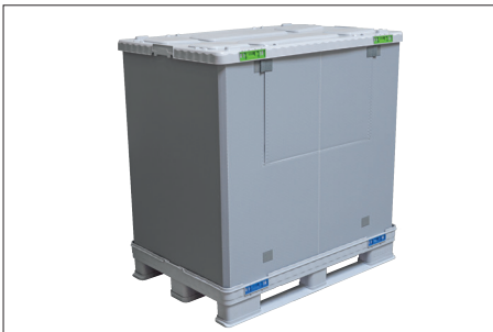
7. Doludan sonra alım klapesi kapatılır ve kapak takılır.