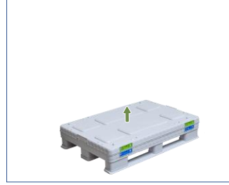
2. Kapağı çıkarın.