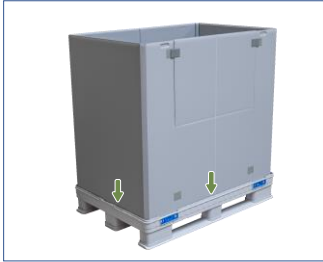
4. Halka tamamıyla açılır ve ana kutunun yuvalarına bastırılır. Kapakların manuel olarak kilitlemesine gerek yoktur.