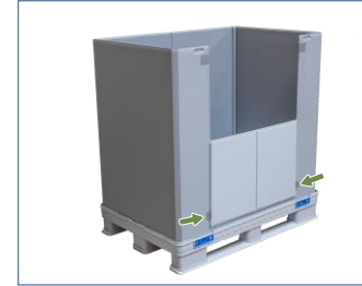
6. Daha iyi tutabilmek için açık olan alım klapesi halkanın çitçitine sabitlenebilir; böylece sıkı biçimde halkada bulunur.