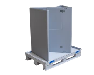
3. Katlanmış halka kurulur ve açılır.