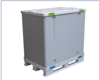
7. Dolumdan sonra alım klapesi kapatılır ve kapak takılır.