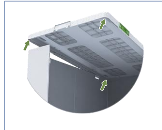
8. Kapakta, kapağın kolayca yerleştirilmesine imkan veren halka klavuzlar mevcuttur. Kapakların manuel olarak kilitlemesine gerek yoktur.