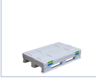
1. Katlanmış SLP.