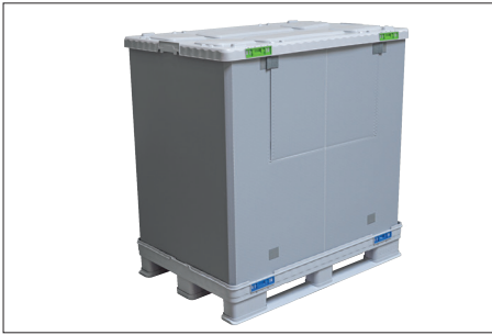
1. Kurulmuş SLP.