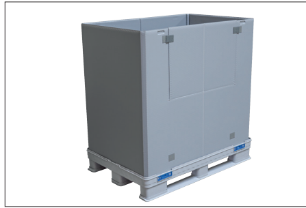
2. Kapađı çıkarın. Kapaklarda manuel olarak bir şey yapmaya gerek yoktur. Kapak basitçe yukarı doğru çekilir ve çıkarılır.