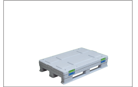
6. Son olarak kapak yerleřtirilir.