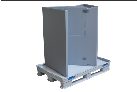
4. Halka katlanır.