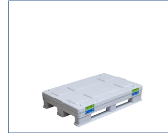
6. Son olarak kapak yerleştirilir.