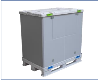
1. Kurulmuş SLP.