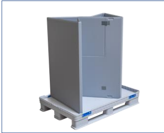
4. Halka katlanır.