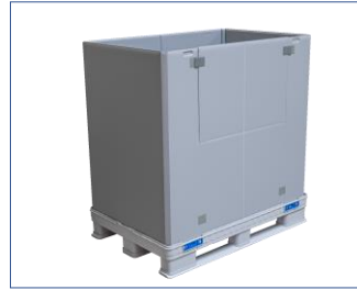
2. Kapağı çıkarın. Kapaklarda manuel olarak bir şey yapmaya gerek yoktur. Kapak basitçe yukarı doğru çekilir ve çıkarılır.