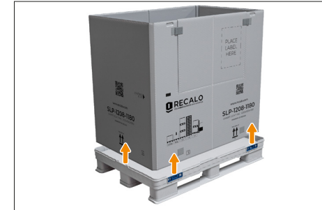
3. Dann wird der Ring aus dem Grundkasten auch einfach nach oben herausgezogen.