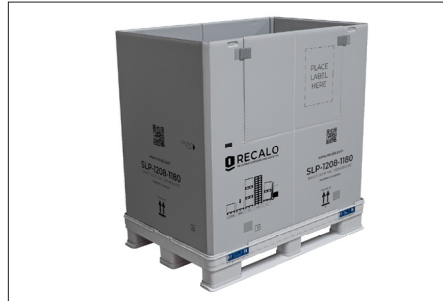
2. Den Deckel abnehmen. Es ist kein manueller Aufwand an den Verschlüssen notwendig. Der Deckel wird einfach nach oben gezogen und abgenommen.