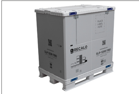
1. Aufgebauter SLP.