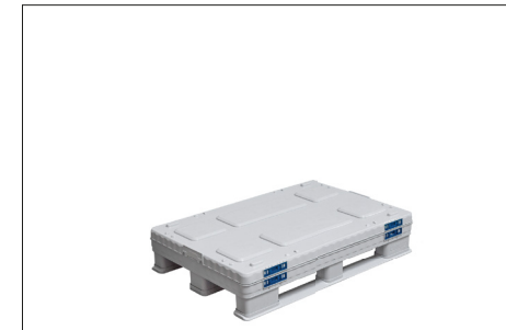
6. Zum Schluss wird noch der Deckel aufgelegt.