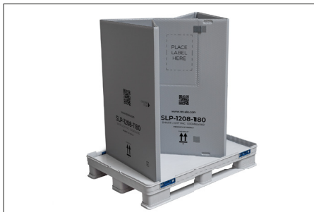
4. Der Ring wird gefaltet.