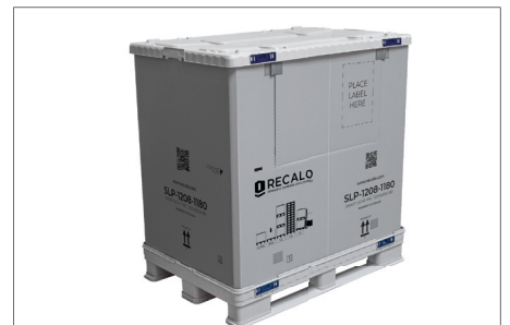
9. Aufgebauter geschlossener SLP.