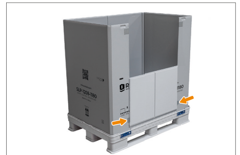
6. Zum besseren Handling kann die geöffnete Entnahmeklappe an den Klett pads des Ringes befestigt werden, wodurch sie eng am Ring anliegt.