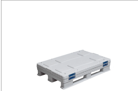
1. Zusammengefalteter SLP.