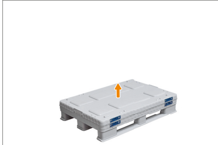
2. Den Deckel abnehmen.