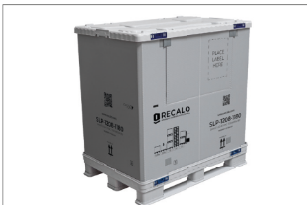
7. Nach dem Befüllen wird die Entnahmeklappe geschlossen und der Deckel aufgelegt.