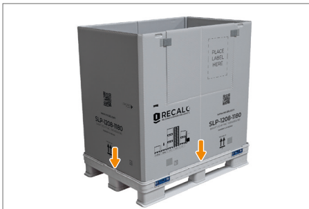
4. Der Ring wird vollständig entfaltet und in die Aufnahmen des Grundkastens gedrückt. Es ist keine manuelle Verriegelung der Verschlüsse erforderlich.