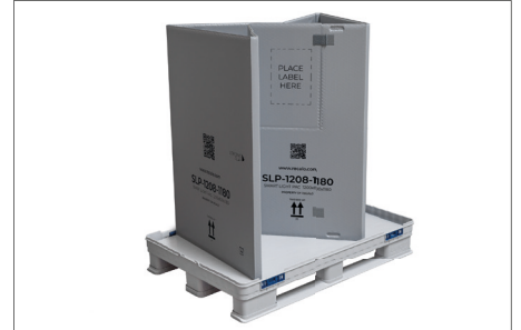
3. Der zusammengefaltete Ring wird aufgestellt und entfaltet.