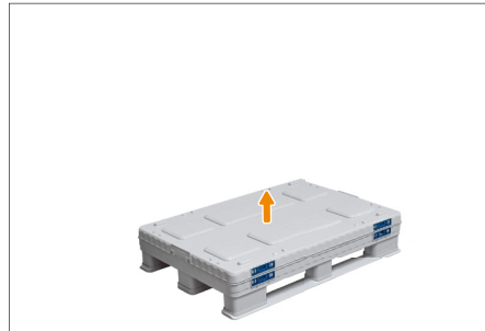
2. Den Deckel abnehmen.