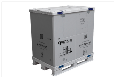
7. Nach dem Befüllen wird die Entnahmeklappe geschlossen und der Deckel aufgelegt.