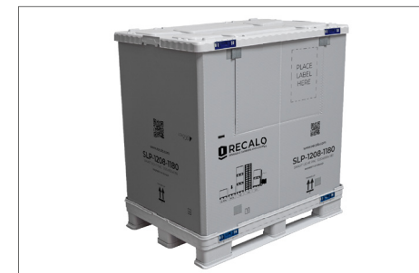
9. Aufgebauter geschlossener SLP.