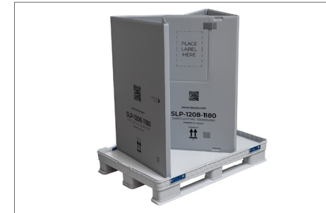
3. Der zusammengefaltete Ring wird aufgestellt und entfaltet.