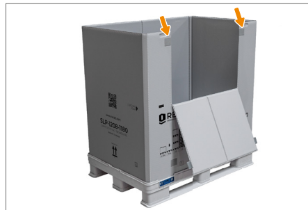
5. Zum besseren Beladen kann die Entnahmeklappe geöffnet werden, dazu Entnahmeklappe nach außen ziehen bis sich die Klettverschlüsse lösen.