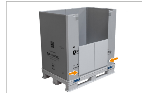
6. Zum besseren Handling kann die geöffnete Entnahmeklappe an den Klett pads des Ringes befestigt werden, wodurch sie eng am Ring anliegt.