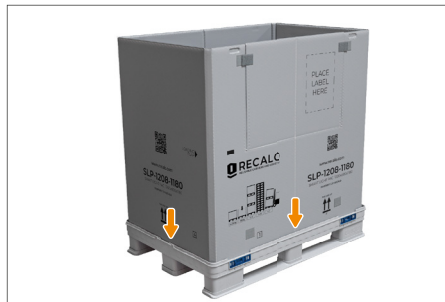
4. Der Ring wird vollständig entfaltet und in die Aufnahmen des Grundkastens gedrückt. Es ist keine manuelle Verriegelung der Verschlüsse erforderlich.